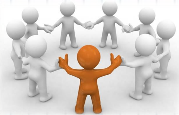
Рабочие группы (представительство от УВЦ)