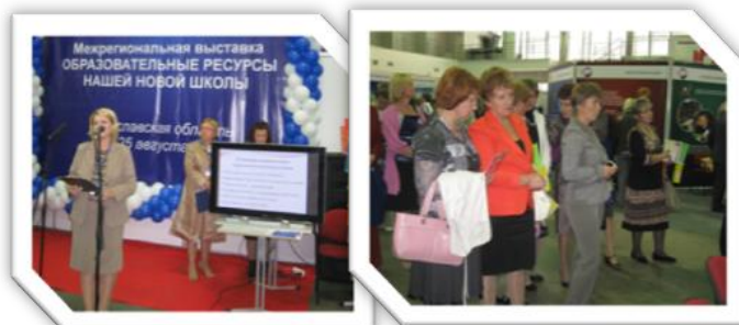
Межрегиональная выставка «Образовательные ресурсы нашей новой школы» г. Ярославль