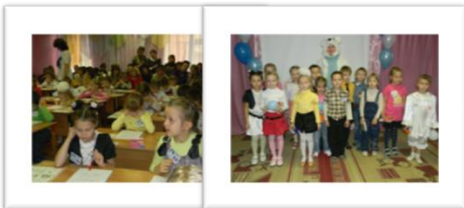
Интеллектуальная олимпиада дошкольников «Умка»