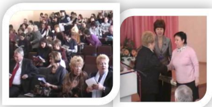
Муниципальная конференция «Учитель! В имени твоём...»