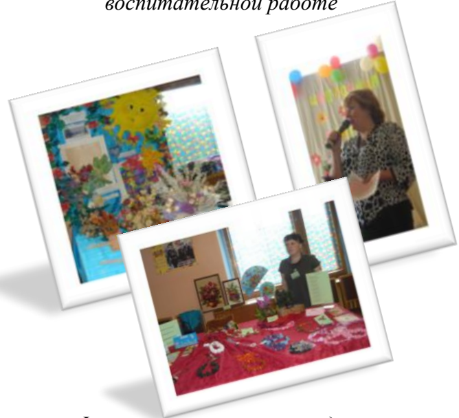
Фестиваль творчества педагогов «Цветочная феерия»