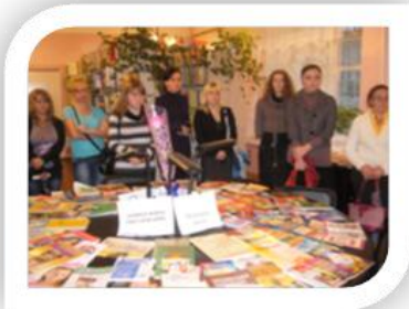
Прием молодых специалистов в МОУ ДПО ИОЦ