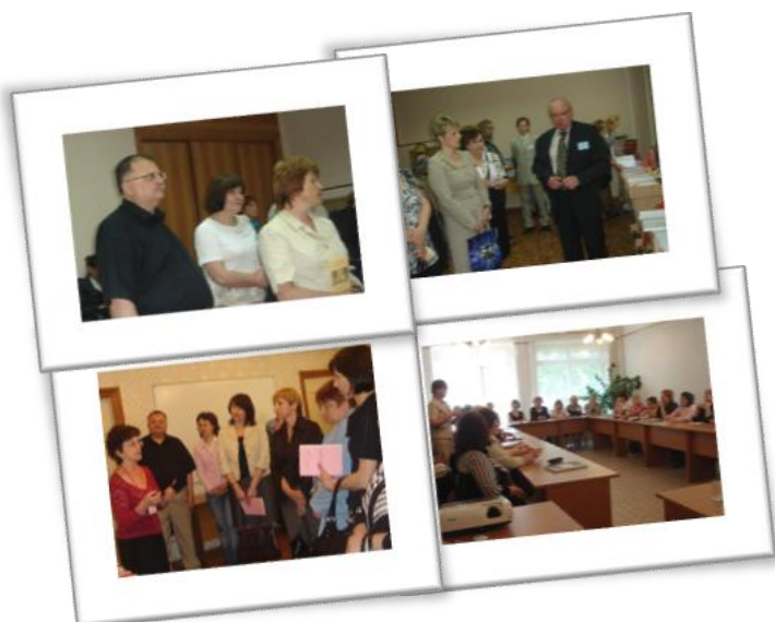
Региональный семинар «Реализация целевой городской программы «Одарённые дети» в г.Рыбинске»