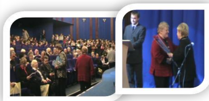
Областная образовательная конференция «Волголаг в истории Рыбинского края»