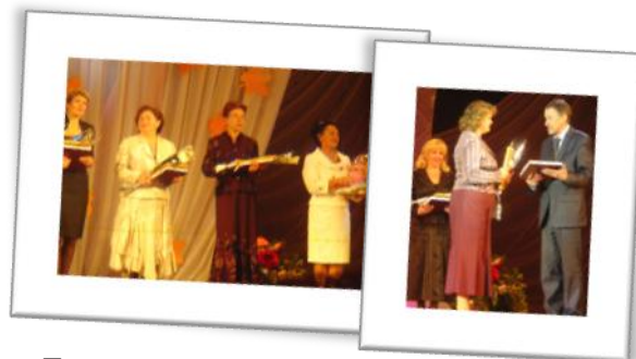
Торжественный вечер, посвященный Дню учителя