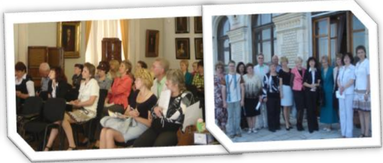
ИМС для заместителей директоров по воспитательной работе