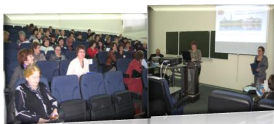
Всероссийский конкурс инновационных моделей муниципальных методических служб «Методическая служба – новой школе» г. Москва