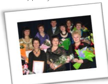
Конкурс «Учитель года-России»