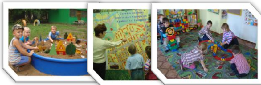
Конкурс дошкольных образовательных учреждений по дорожно-транспортному травматизму «Зеленый огонек»