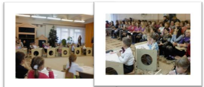
Экологическая олимпиада дошкольников