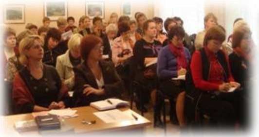
ИМС для заместителей директоров по УВР ОУ