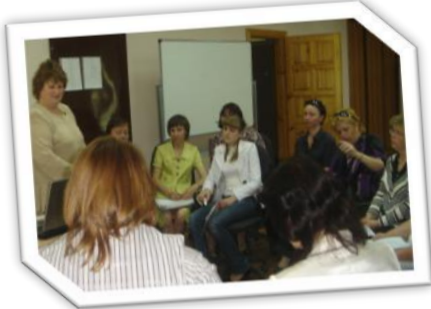
Учебные занятия по ИКТ