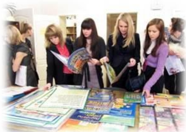
Торжественный прием молодых специалистов