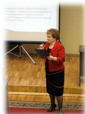
Муниципальная Ярмарка инновационных продуктов