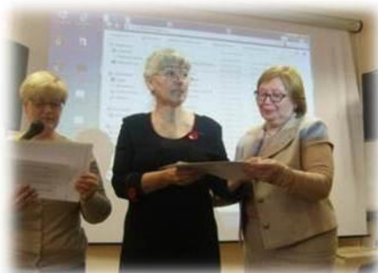
Конференция «Федеральный государственный образовательный стандарт: достижение планируемых результатов средствами Образовательной системы «Школа 2100»