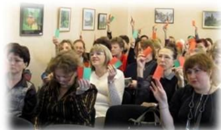
Семинар-практикум «Профилактика и коррекция детской жестокости и агрессивности»