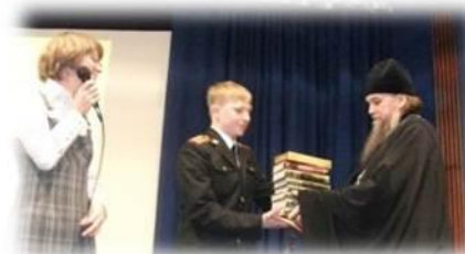
Историческая викторина «Адмирал Фёдор Ушаков»