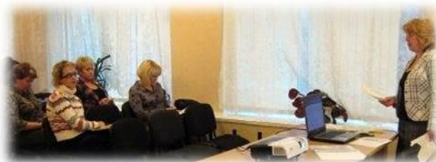
Семинар-презентация «Использование технологии личностного роста в образовательном учреждении»