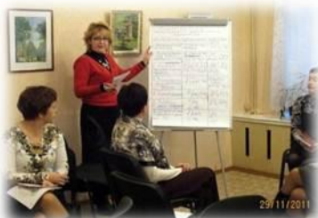
Семинар стратегической команды системы образования города «Образование будущего создаём сегодня»