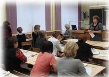
Семинар «Условия для реализации ФГОС второго поколения в ИКТ-насыщенной среде образовательного учреждения»