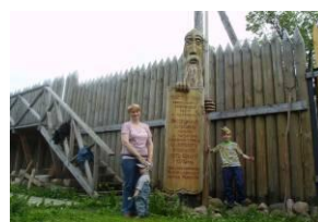
Проект семьи Суховых «Прогулка с интересом или в гости к археологам».