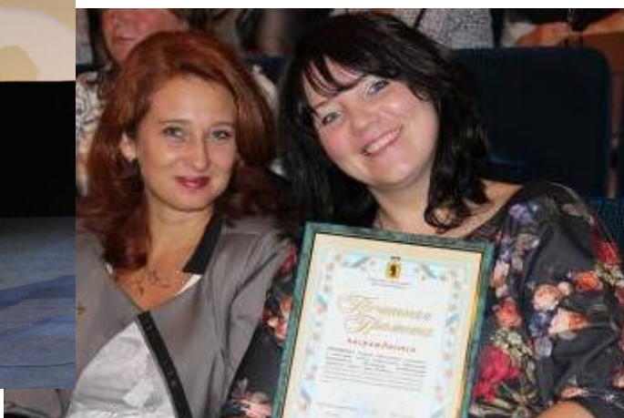
Августовское совещание педагогических работников системы образования 29 августа 2013 года