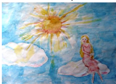
работа ученицы 6 «В» класс

«На неверных весах моей души» из кантаты «Кармина Бурана»