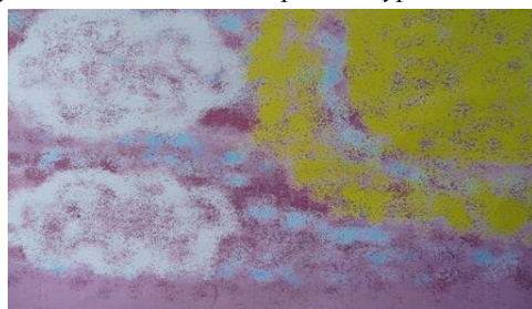
работа ученицы 6 "Б" класс

10. Подбор художественного ряда . Детям предлагается подобрать произведения живописи, созвучные услышанному произведению. Эта работа может быть оформлена на компьютере в качестве слайд-шоу.