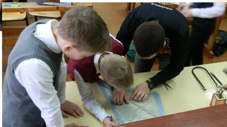
Мейкерспейс «Кубок мечты»