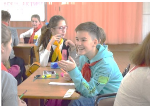
Осенняя школа актива «Новое поколение»

«Событие – явление настоящее, «Событие – явление настоящее, а не «понарошечное» а не «понарошечное»