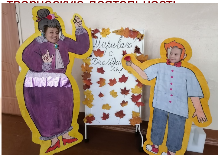
самое яркое событие осени «День учителя-Новый формат»

+ Опыт внедрения Событийной технологии в практику реализации рабочей программы воспитания в ОО позволяет создавать новый тип отношений участников образовательного процесса – их совместную