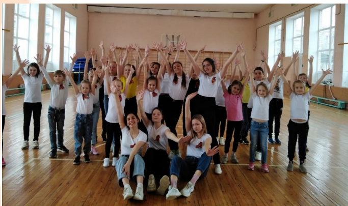
Открытый патриотический фестиваль «Дети России за мир»