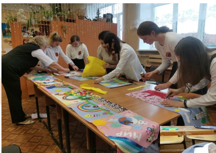
Мейкерспейс «Мы в ответе за мир на планете»

В образовательной практике СОШ №24 имени Бориса Рукавицына к событийным можно отнести: слет (сбор, форум), фестиваль, ролевая игра, дебаты, интеллектуальные турниры, квест, флешмобы, вебквест и др.